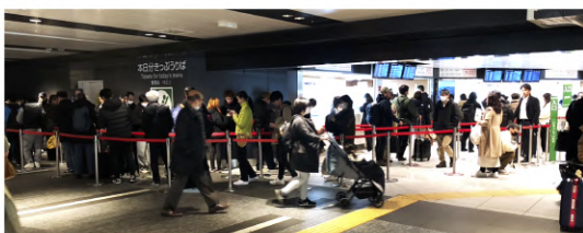
▲2023年末の東京駅のみどりの窓口は大混雑していた

現在、私鉄委託駅と臨時駅を含めると212駅にある「みどりの窓口」は、営業施策として削減が進められてきました。しかし、閉鎖に伴う利便性の悪化や残置駅の窓口への集中・混雑などについて、以前から輸送サービス労組が団体交渉で指摘してきたものです。引き続き、利用者の皆さんと連帯した取り組みで、さらなる改善をめざしていきます。