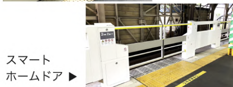
スマートホームドア