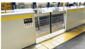
フル規格のホームドア

集会では「中編成ワンマン運転」によって発生している「あわや死傷事故」にもなり得る事象があとを絶たずに発生していることやその対策もおおざなりとなっていること、懸念されていることなど、非常に多くの発言がされました。集会に参加された議員の方々からは、「あの両数の車両を一人で運転するのは考えられない。何かあったら対応できないのは明らか」「長編成ワンマン運転導入線区沿線の自治体で、議員同士も連携していきなさい」との感想も出されました。